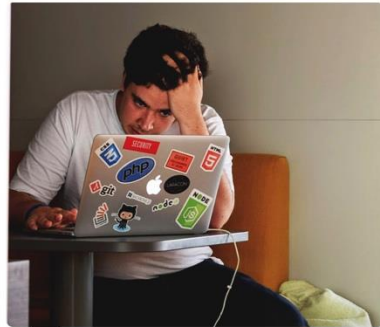
Stress over schoolwerk