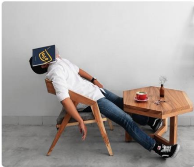
Moeite met 'leren leren'