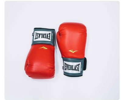
Soms strijd in huis